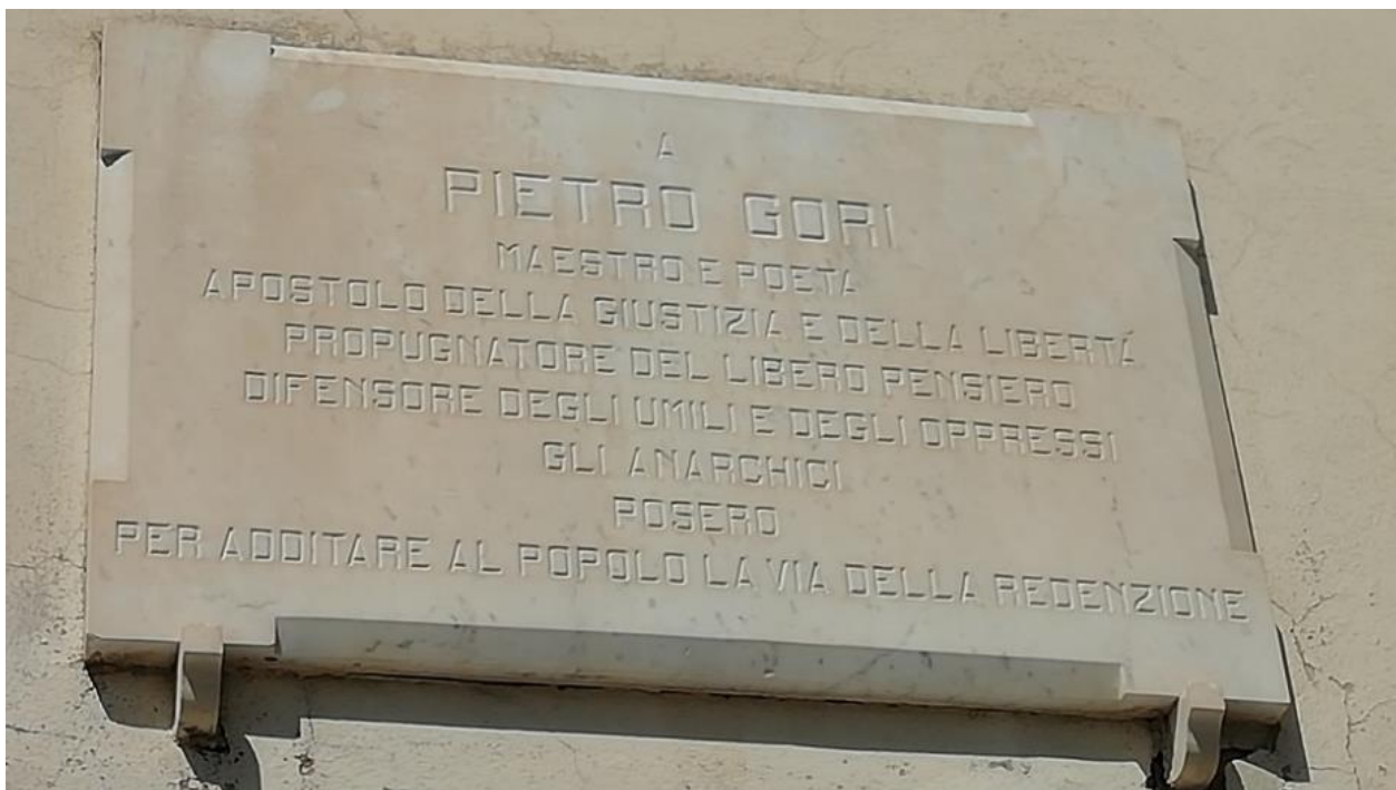
Figura 3 – L'epigrafe bibbonese dedicata a Pietro Gori

"a PIETRO GORI / maestro e poeta / apostolo della giustizia e della libertà / propugnatore del libero pensiero / difensore degli umili e degli oppressi / gli anarchici / posero / per additare al popolo la via della redenzione"